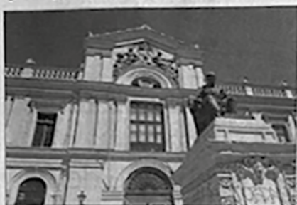
La U. de Chile declaró que "rechazamos toda forma de censura, de vulneración a la libertad de cátedra y restricciones a la autonomía universitaria".

En mayo ambos parlamentarios ya habían sido cuestionados por buscar prohibir, a través de un proyecto de ley, el lenguaje inclusivo en los colegios por tratarse de una "ideología perversa".