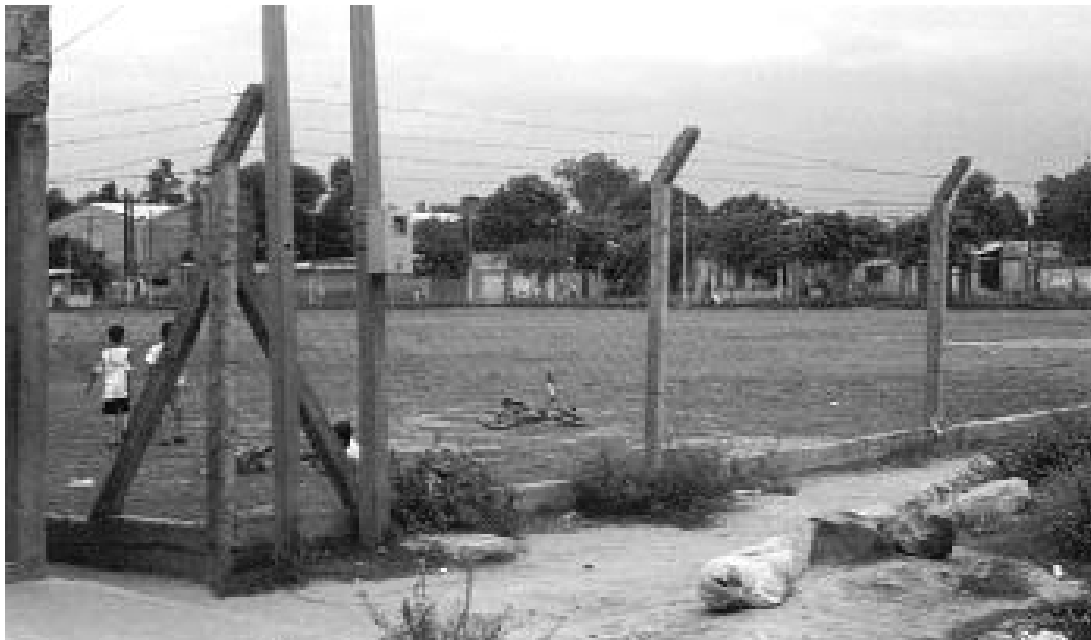
FOTO 4: VISTA ACTUAL DE LA CANCHA DE FÚTBOL, ÚNICO ESPACIO VERDE COLECTIVO DEL BARRIO TIRO FEDERAL

Dicha Plaza se encuentra demasiado alejada de las viviendas como para ser usada y apropiada por la gente del barrio. Ch. Alexander manifiesta: «La gente necesita lugares abiertos y verdes adonde ir; cuando están cerca los usan. Pero si están a más de tres minutos de distancia, esa lejanía acaba prevaleciendo sobre la necesidad» . ▶ 10