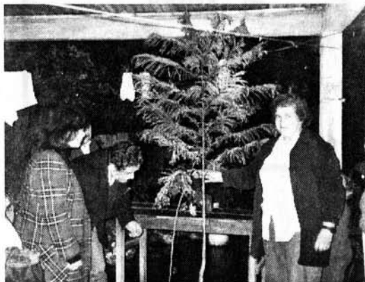
FOTO 8: SELECCIÓN DE ESPECIES, SEGÚN REGLAMENTACIONES VIGENTES, CON LOS VECINOS DEL BARRIO