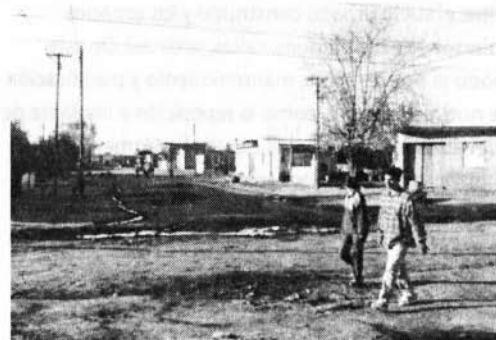
FOTO 3: DEFICIENTE CALIDAD DE LOS ESPACIOS URBANOS PÚBLICOS DEL BARRIO POR LA FALTA DE INFRAESTRUCTURA Y ESCASA VEGETACIÓN

→ Ausencia de espacios verdes comunes al barrio (Plazas o Plazoletas). Solo existe un espacio verde delimitado por una cerca, usado como Cancha de Fútbol. La Plaza más cercana pertenece al barrio Sarmiento (a 5 cuadras del Barrio).