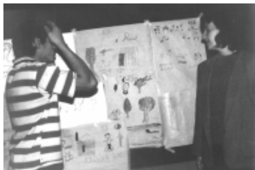
FOTO 7: CONCURSO ESTUDIANTIL SOBRE "VEGETACIÓN Y HÁBITAT POPULAR"