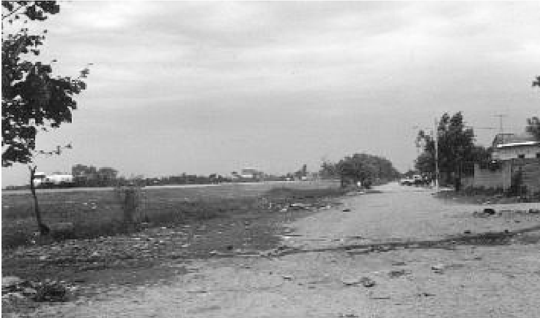
FOTO 2: IMÁGENES QUE REVELAN LA PRECARIA INSERCIÓN DE LOS BARRIOS PERIFÉRICOS EN EL TEJIDO URBANO Y AL SISTEMA SOCIAL

sectores del pueblo a partir de su interacción directa, como respuesta solidaria a necesidades compartidas”.