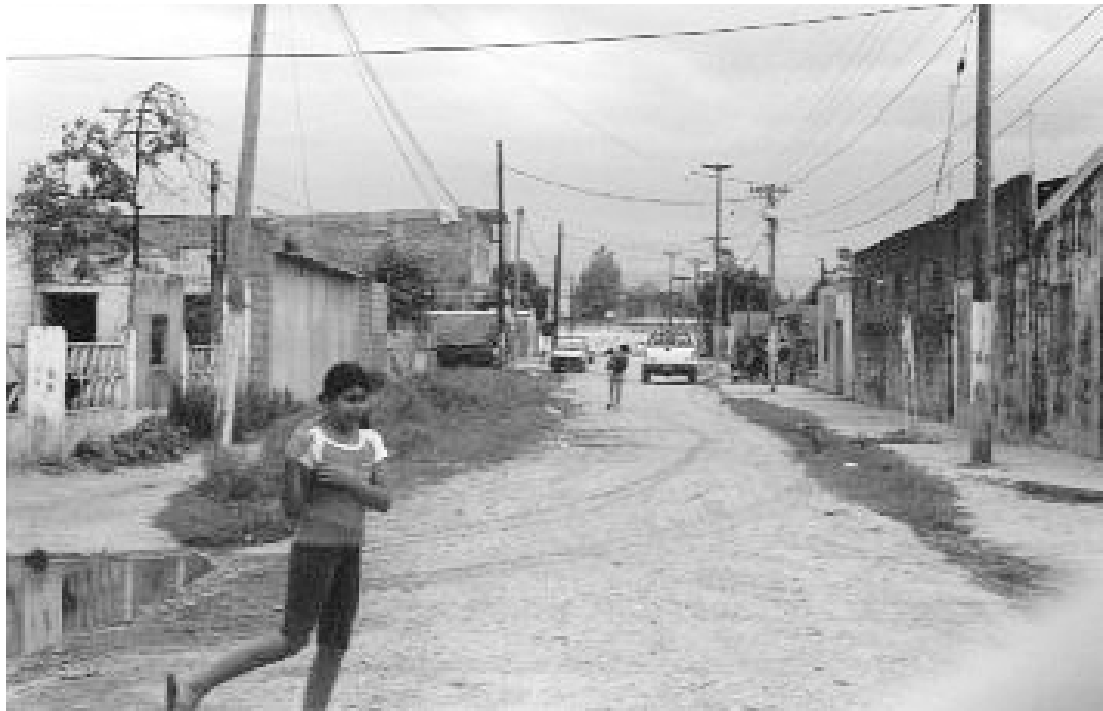
FOTO 1: PAISAJE URBANO CARACTERIZADO POR LA FALTA DE PAVIMENTO EN CALLES Y VEREDAS, ESCASEZ DE ÁRBOLES, ÁMBITO DE POCa SALUD AMBIENTAL.