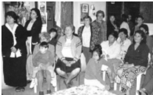
FOTO 5: BÚSQUEDA CONJUNTA DE VECINOS Y TÉCNICOS DE SOLUCIONES A LA PROBLEMÁTICA BARRIAL

La idea de esta intervención, a pequeña escala es favorecer un modo de crecimiento, a mediano y largo plazo, cuyo impacto será el resultado de los diferentes experiencias llevadas a cabo por los técnicos y la comunidad (huertas, árboles frutales, cocinas y hornos eficientes, arbolado urbano, ampliación de habitaciones en vivienda, etc.)